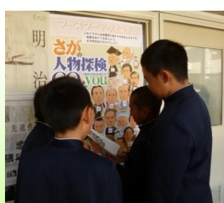
中川副小学校のクイズ大会