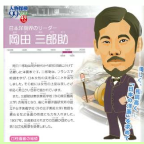
岡田三郎助の紹介