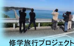
修学旅行プロジェクト