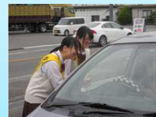
交通安全の街頭キャンペーン

福祉研究部を中心に、地域貢献を目指し、各々ができるボランティア活動に取り組んでいます。