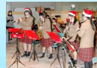
介護施設訪問コンサート