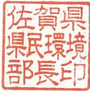
佐賀県県民環境部長印