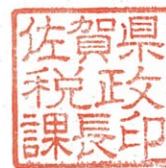
佐賀県税政課長印