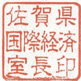
佐賀県国際経済室長印