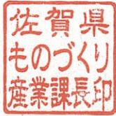
佐賀県ものづくり産業課長印