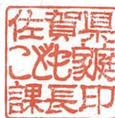
佐賀県こども家庭課長印