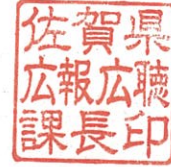
佐賀県広報広聴課長印