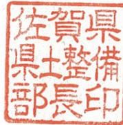
佐賀県県土整備部長印