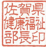
佐賀県健康福祉部長印