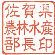
佐賀県農林水産部長印