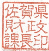
佐賀県財政課長印