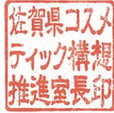
佐賀県コスメティック構想推進室長印