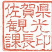
佐賀県観光課長印