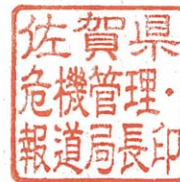
佐賀県危機管理・報道局長印