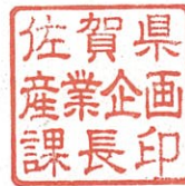
佐賀県産業企画課長印