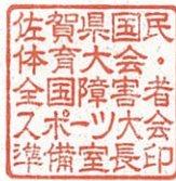
佐賀県国民体育大会・全国障害者 スポーツ大会準備室長印