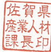
佐賀県産業人材課長印