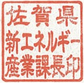
佐賀県新エネルギー産業課長印