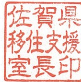
佐賀県移住支援室長印