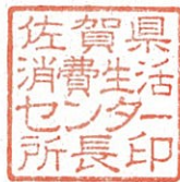
佐賀県消費生活センター所長印