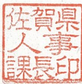
佐賀県人事課長印