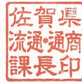
佐賀県流通・通商課長印