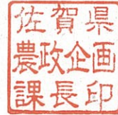
佐賀県農政企画課長印