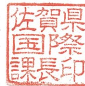
佐賀県国際課長印