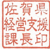
佐賀県経営支援課長印