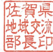
佐賀地域交流部長印