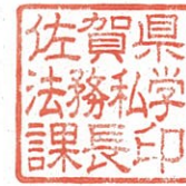
佐賀県法務私学課長印