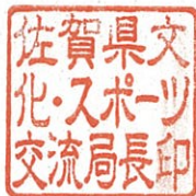
佐賀県文化・スポーツ交流局長印