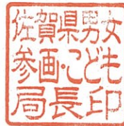
佐賀県男女参画・こども局長印