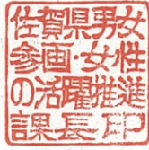
佐賀県男女参画・女性の活躍推進課長印