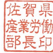
佐賀県産業労働部長印