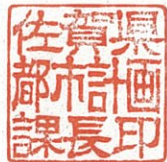
佐賀県都市計画課長印