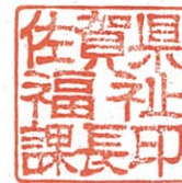
佐賀県福祉課長印