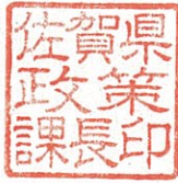
佐賀県政策課長印