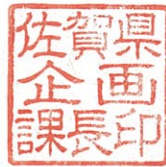
佐賀県企画課長印