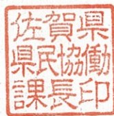
佐賀県県民協働課長印