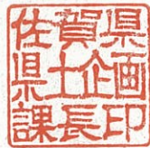
佐賀県県土企画課長印