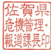
佐賀県危機管理・報道課長印