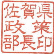
佐賀県政策部長印