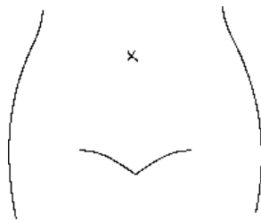
(腸瘻及びびらんの部位等を図示)