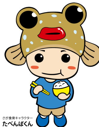
さが食育キャラクター たべんばくん