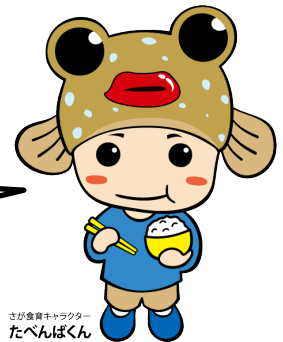
さが食育キャラクター たべんぼくん

会員の皆様の素敵な取り組みがありましたら、ぜひ事務局までご一報ください！ 取材にお伺いさせていただきます！