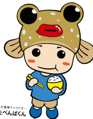
さが食育キャラクター たべんぼくん

受賞者のみなさま！ おめでとうございます！ これからも、一層食育の推進にご尽力いただきますよう、お願いいたします。 受賞者のみなさまの活動紹介については、次号（5月）に記載いたします。