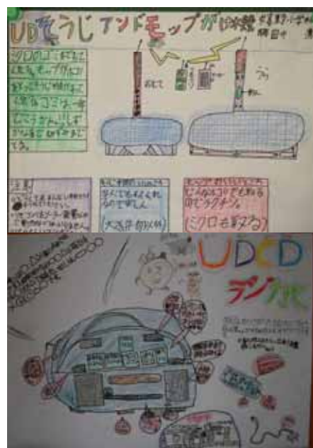
< 児童が考えたUD >