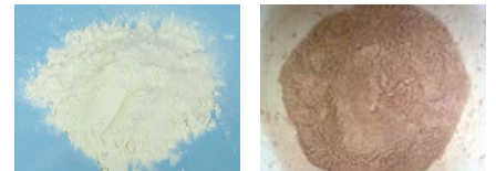
レンコン粉末を使ったマウス実験の結果、レンコンポリフェノールが脂肪肝の改善に有効なことが明らかに(左はレンコンを粉末化したもの、右はレンコンから抽出したポリフェノール)