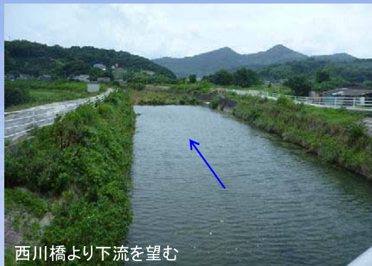
西川橋より下流を望む