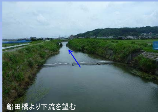
船田橋より下流を望む