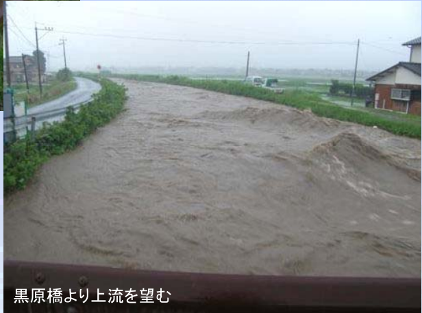
黒原橋より上流を望む