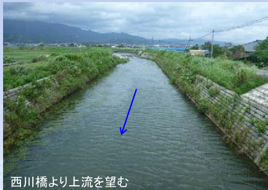
西川橋より上流を望む