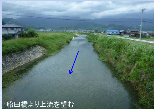
船田橋より上流を望む