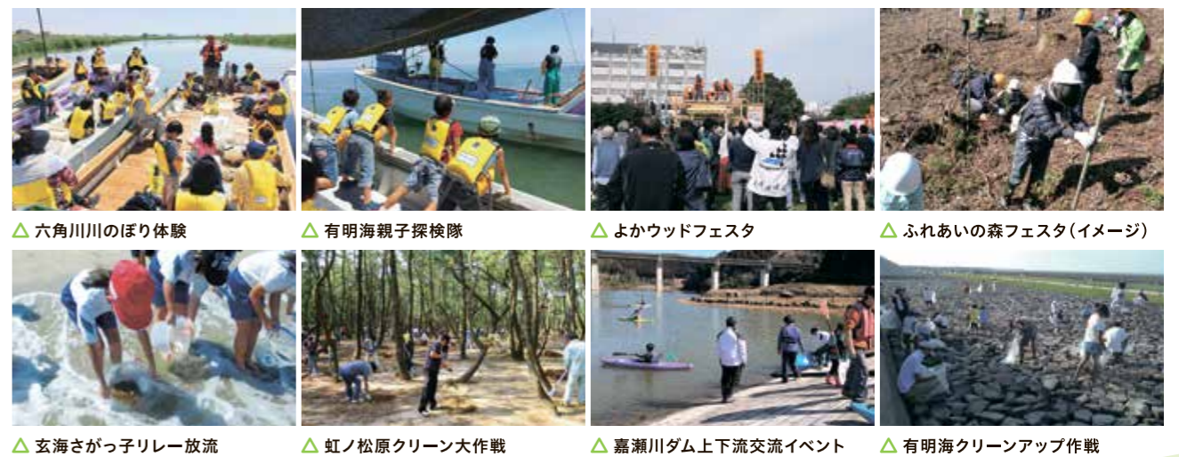
△六角川川のぼり体験 △有明海親子探検隊 △よかウッドフェスタ △ふれあいの森フェスタ(イメージ) △玄海さがっ子リレー放流 △虹ノ松原クリーン大作戦 △嘉瀬川ダム上下流交流イベント △有明海クリーンアップ作戦

県では、県民の皆さんに、森・川・海が重要な役割を果たしていることを知ってもらい、保全活動などの行動につなげていただきたいと考え、「森川海人っプロジェクト」に取り組んでいます。 今年度は、本プロジェクトの取り組みを紹介するとともに、誰でも気軽に参加できるイベントを開催する予定です。 佐賀の豊かな自然を守るため、イベントへの参加などを通して、森・川・海の力を感じてください。 ●「森川海人っプロジェクト」は、「もりかわかいとプロジェクト」と読み、「森・川・海はひとつ」という思いを「人がつなぐ」プロジェクトです。