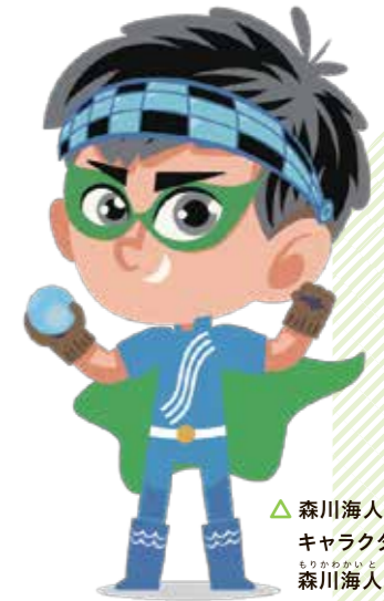
△森川海人っプロジェクト キャラクター 森川海人くん

県では、県民の皆さんに、森・川・海が重要な役割を果たしていることを知ってもらい、保全活動などの行動につなげていただきたいと考え、「森川海人っプロジェクト」に取り組んでいます。 今年度は、本プロジェクトの取り組みを紹介するとともに、誰でも気軽に参加できるイベントを開催する予定です。 佐賀の豊かな自然を守るため、イベントへの参加などを通して、森・川・海の力を感じてください。 ●「森川海人っプロジェクト」は、「もりかわかいとプロジェクト」と読み、「森・川・海はひとつ」という思いを「人がつなぐ」プロジェクトです。