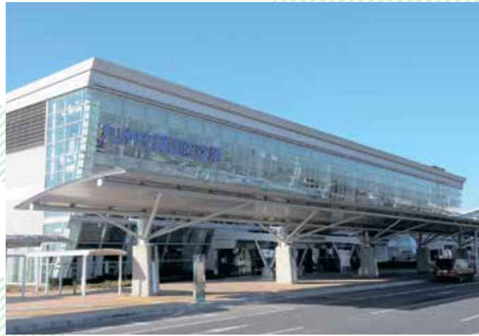
△九州佐賀国際空港