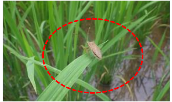
ホソハリカメムシ