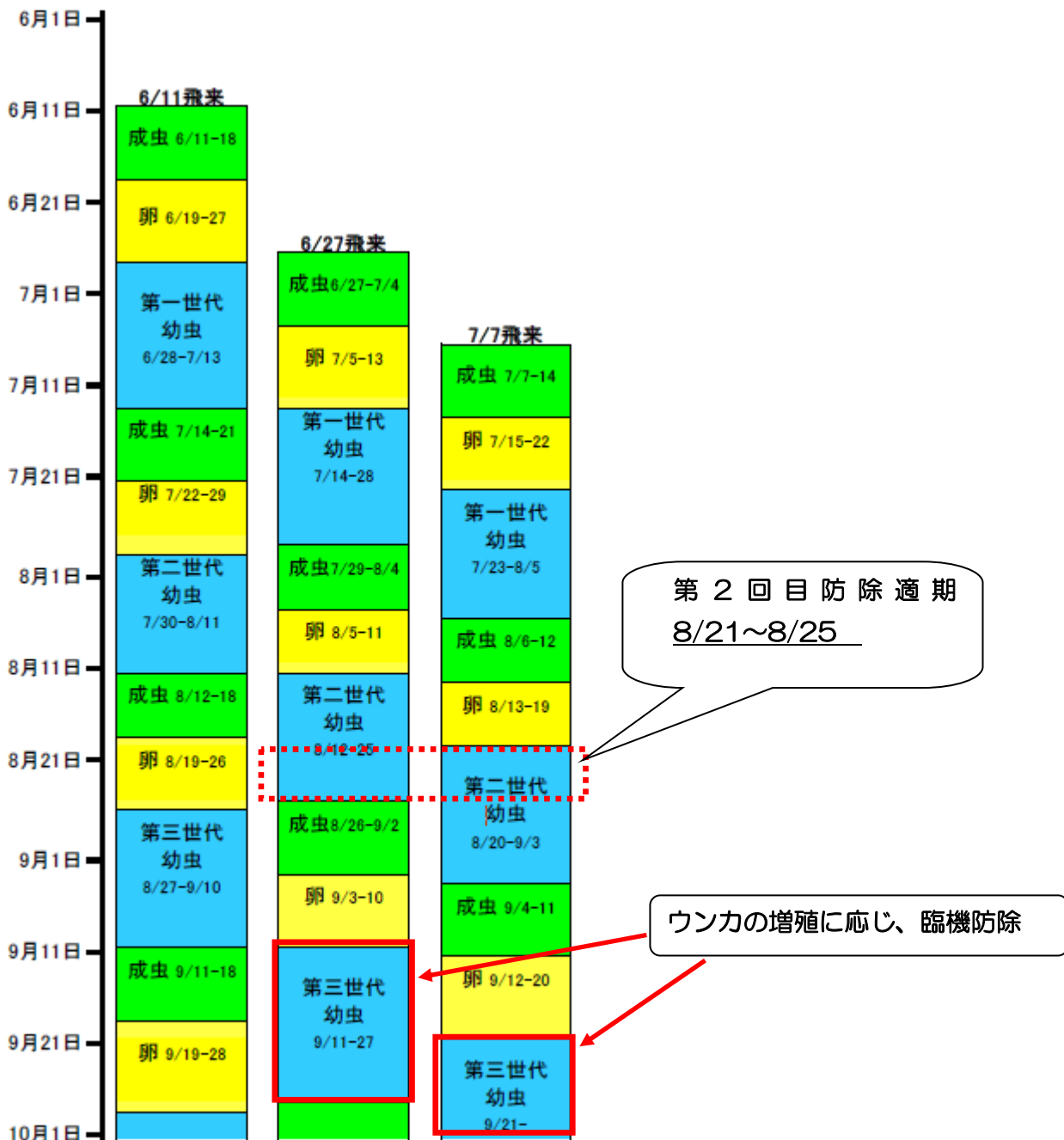
図1 トビイロウンカ各世代の発生予測(第6版、2020年8月19日作成)

農技防 HP 参照：病害虫情報： http://www.pref.saga.lg.jp/kiji00368010/index.html