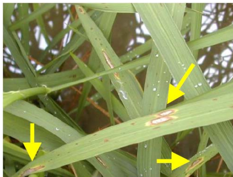
▲いもち病