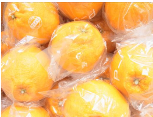
写真4 不知火の果実個装の様子