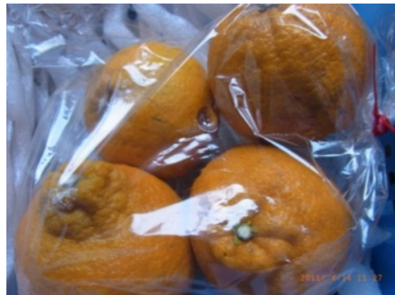
写真5 複数個の果実を同一袋に入れた場合 (一つの袋に複数個の果実を入れると結露しやすい)