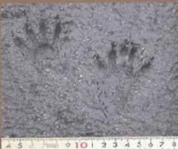
湿地に残ったアライグマの足跡。 ◀左：前足 右：後ろ足

森林の水辺を好み、農耕地や市街地周辺にも出没します。特にため池の流入部、樹林内の湿地や溪流などで多く確認されています。夜行性で昼間は暗い所に隠れているためあまり目撃されることはありません。行動圏は 40～100ha と言われています。