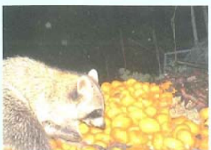
▲ 廃棄ミカンを食べるアライグマ。廃棄する農作物を放置しているとアライグマを呼び寄せる原因となります。

カキ、スイカ、ミカン、イチゴ、キウイ、ブドウ、ナシ、トウモロコシ等の農作物の食害、畜産飼料の食害、養魚場や養鶏場への侵入や食害が確認されています。