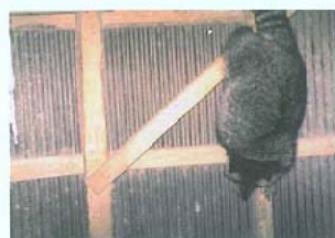
▲ 垂直な壁を降りるアライグマ。すみかや餌を目的に入り込みます。

市街地に進出し、ゴミ捨て場を荒らしたり、家屋の天井裏にすみつき、家屋の破壊や糞尿による被害を及ぼします。神社や仏閣にも侵入するため、文化財への損害も報告されています。また、アライグマ回虫、狂犬病などの感染症の媒介によって人やペットへの影響も懸念されます。