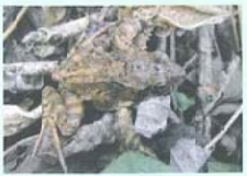
▲ ヤマアカガエル 日本固有種。平地から山間部に生息し、池沼・湿地の浅いところに産卵します。

樹上の鳥の巣を襲ったり、樹洞に侵入しフクロウ、ムササビ、コウモリなどを追い払ったり、水辺でサンショウウオやカエル類などを捕食します。また、他の動物に対して感染症や寄生虫を媒介する可能性があり、希少な野生動物の減少など、日本の生態系へ重大な被害をもたらすことが懸念されています。