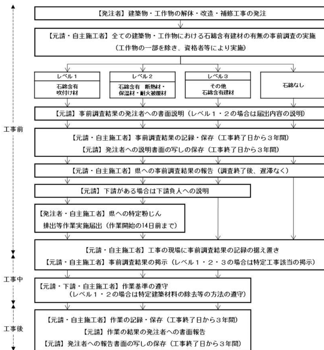
図1 建築物・工作物の解体・改造・補修工事における大気汚染防止法の規制の概要