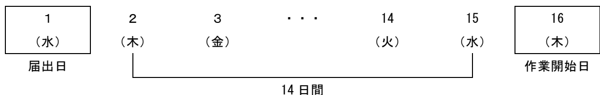
図 3 特定粉じん排出等作業実施届出の届出日