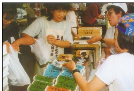
伝統産業を通じた交流の様子

本区域は羊羹や酒造に代表される伝統産業、星巖寺や千葉城跡等の歴史・文化といった特色を活かすとともに、中心市街地の活性化を図り、周辺都市との観光や産業面等における連携・交流を活発に行うまちを目指す。