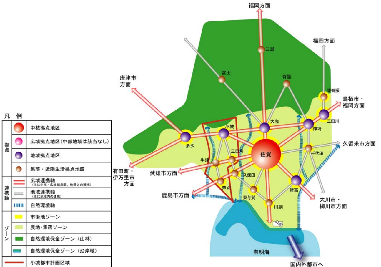
図-3 将来地域構造(中部地域都市計画マスタープランから抜粋)