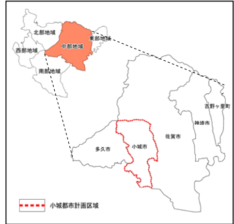
図-2 小城都市計画区域の位置

また、羊羹や酒造に代表される伝統産業や歴史・文化資源、天山山系や有明海等の自然的資源を活かした広域的な交流の促進が求められる。