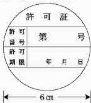
第4号様式(第4条関係)