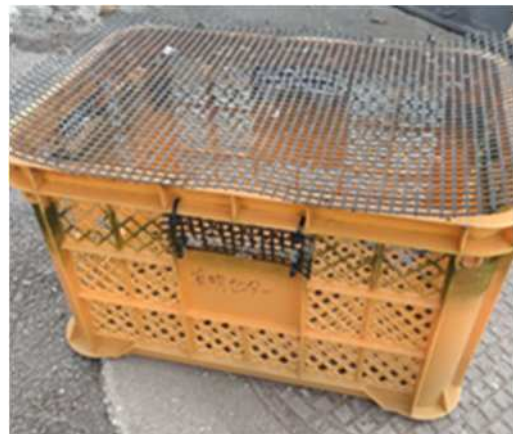
写真1 野菜収穫カゴ

また令和6年度の移植養殖試験でも、10～11月までに生残率が50%以下まで低下しており、令和7年度も同様に、浜地先と東与賀地先で11月までに生残率が30%以下まで低下した。