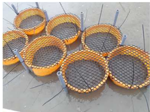
写真2 養殖試験の様子