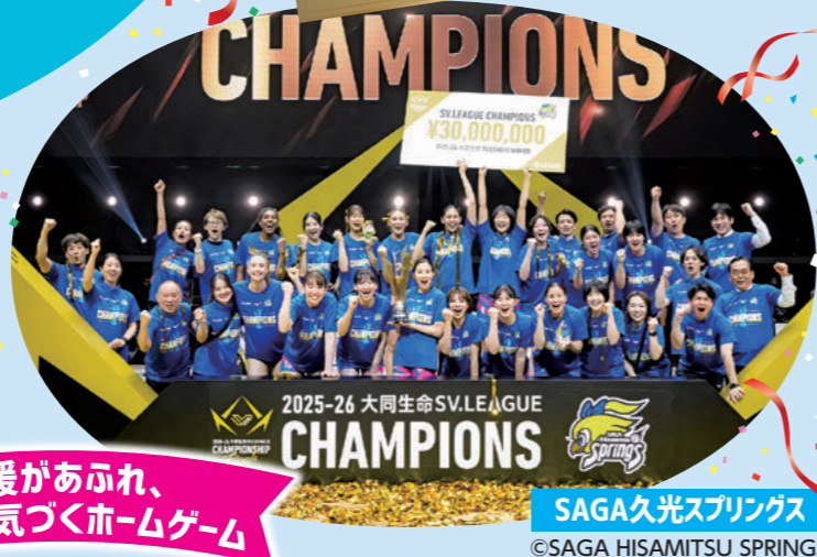
SAGA久光スプリングス