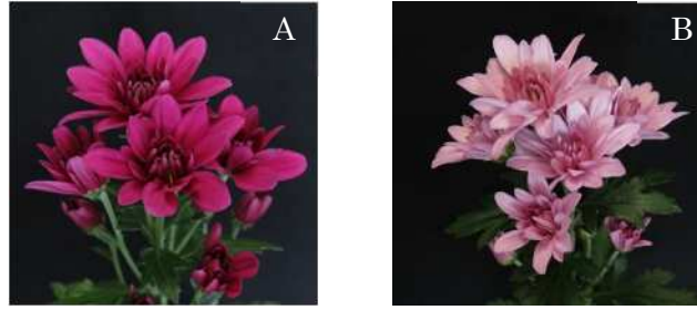
図1 夏秋スプレーギク品種「佐賀SK38号」(A)および「佐賀SK40号」(B)