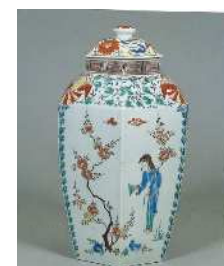
色絵唐人物文六角壺 出光美術館蔵 1911年 江戸時代中期 制作地 中国 江西 景德镇 1911年 General Hexagonal Jar with Design of Figures Chungking Kraak, 1911, China. Museum Number: 1911-1000. Date: 1911. Color: Porcelain with Glaze. 1911, China.