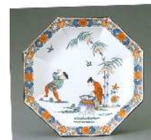
色絵甕割唐子文八角皿(司馬温公図) オーストリア ウィーン 19世紀末 製造 口径19.0cm 高さ3.0cm 底径19.0cm 最大幅19.0cm 出光美術館蔵