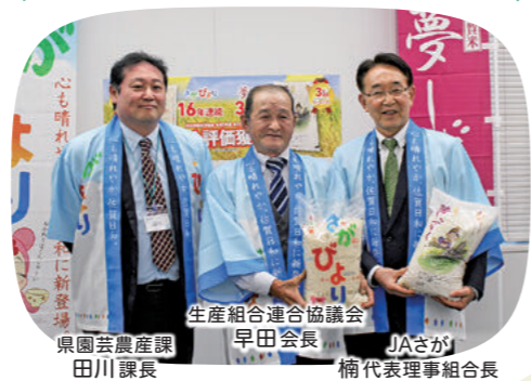
生産組合連合協議会 早田会長 県園芸農産課 田川課長 JAさが 楠代表理事組合長