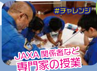
JAXA 関係者など 専門家の授業