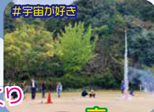
高学年 宇宙を目指す