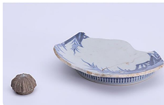
謎のエリア出土の権と鍋島焼