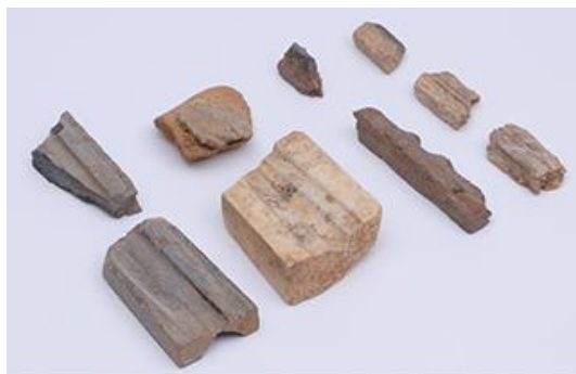
謎のエリア出土の青銅器鋳型