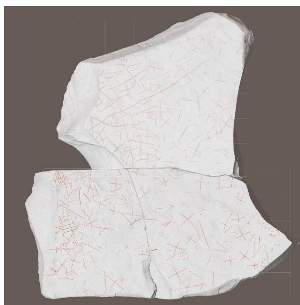
接合する石棺墓の石蓋