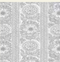
Finlayson™ ©Finlayson Oy

フィンレイソンやマリメッコなどフィンランドデザインのファブリックを多数ご用意。お好みの生地を選び、あなただけのアートを作り上げましょう。 ◎12.6 Sat ◎12.7 Sun 11:30~ 13:30~ 15:30~ 各回定員:10名 参加費:2,000円