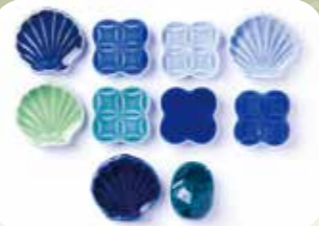
※実際に作成する箸置きは形状・色味は異なります。

4,500以上の釉薬を取り扱う「深海商店」による学習・体験型のワークショップ！自分だけのフィンレイソン×有田焼の箸置きを作ってみましょう。 ◎12.6 Sat ◎12.7 Sun 11:30~ 15:00~ 各回定員:15名 参加費:3,300円