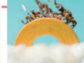
お菓子な虹 © Tatsuya Tanaka