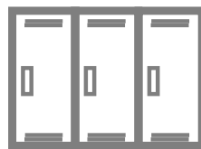
女性専用更衣室の導入