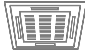
従業員の暑熱対策のための空調の導入