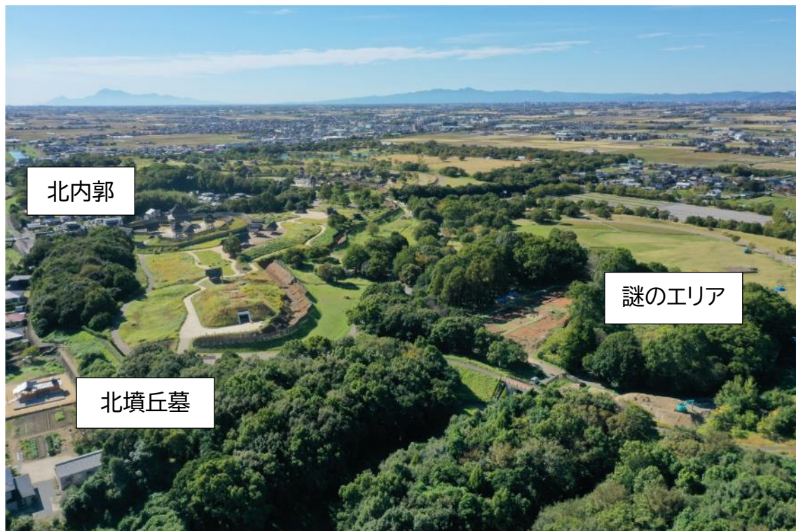
「謎のエリア」と北墳丘墓

https://yoshinogari.fun/news/吉野ヶ里遺跡はっけんフェスタ 2026/