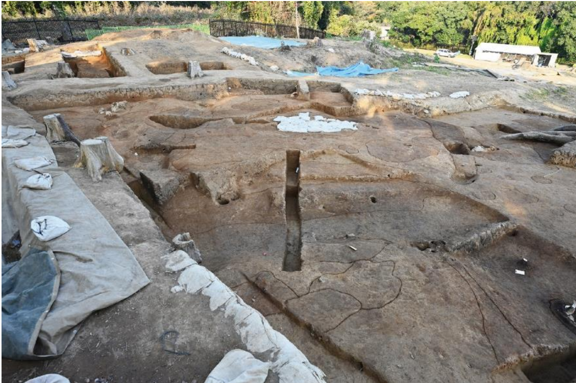
石棺墓と方形周溝検出状況写真