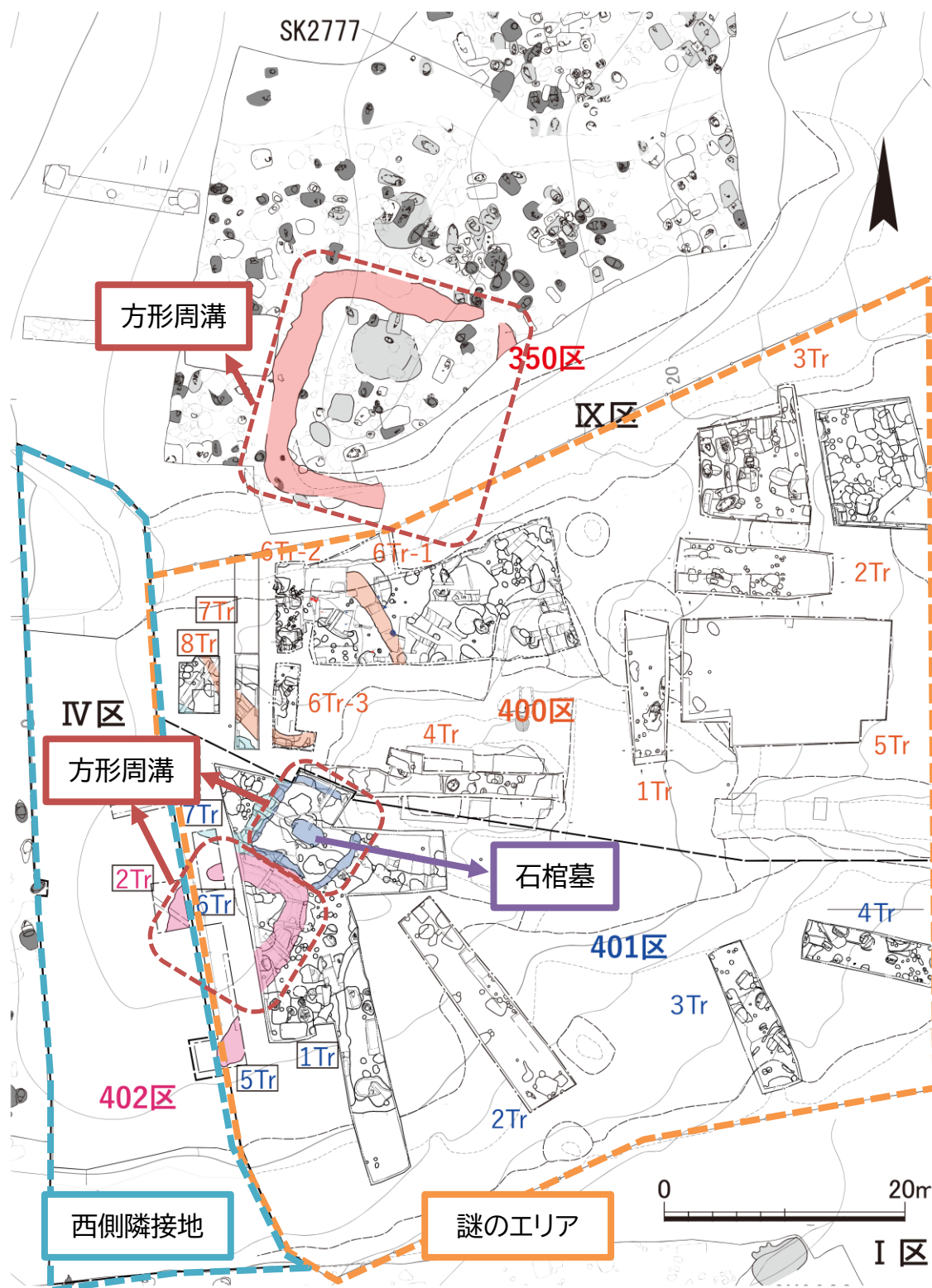
遺構検出状況平面図