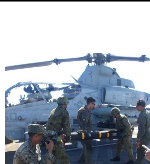
航空機への燃料補給・整備