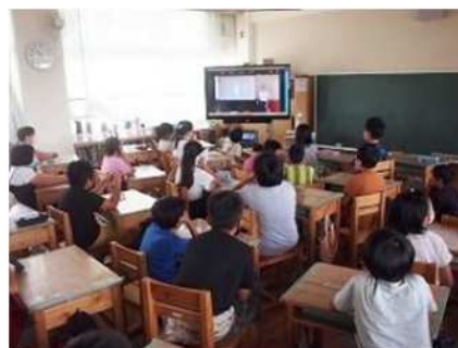
↑ オンライン講座の様子