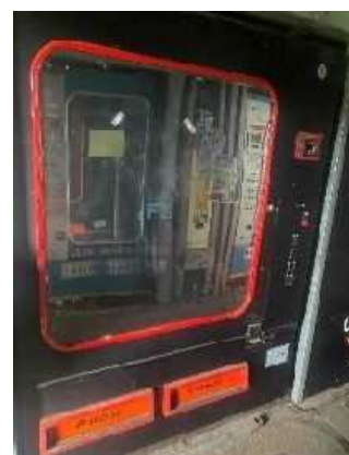
↑ (例) 自動販売機