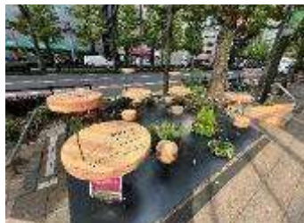
▲協働事業と連携したパークレット (2024 かわさきフェア)