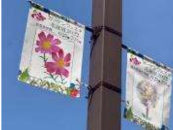
▲小学生による会場フラッグ装飾 (2022 北海道フェア)