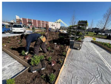
▲植物植栽 (2024 かわさきフェア)