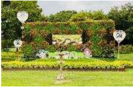
ウェルカムスポット