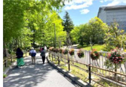
緑スポットの創出