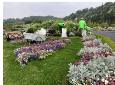
▲花がら摘み・除草 (2023 仙台フェア)