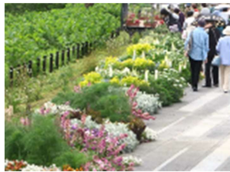
協働でつくる花と緑の展示 (宿根草を中心としたナチュラルスティックガーデンなど)