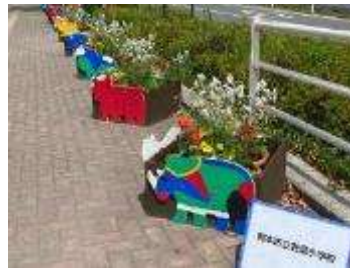
▲小学生によるプランター制作 (左 2021 くまもとフェア、右 2022 北海道フェア)