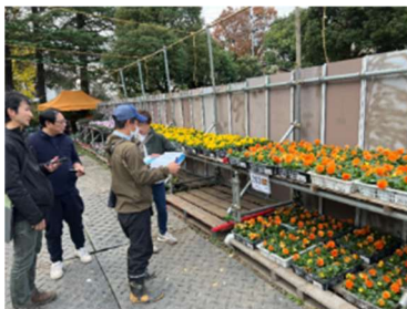
▲納品検収 (2024 かわさきフェア)