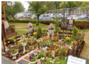
▲フェア終了後に学校周辺で再利用 することを前提とした花壇 (2021 くまもとフェア)