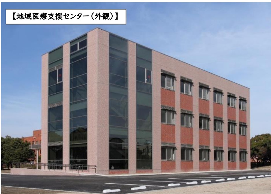
【地域医療支援センター（外観）】