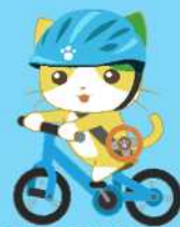
佐贺县交通安全卡通人物 Manyu