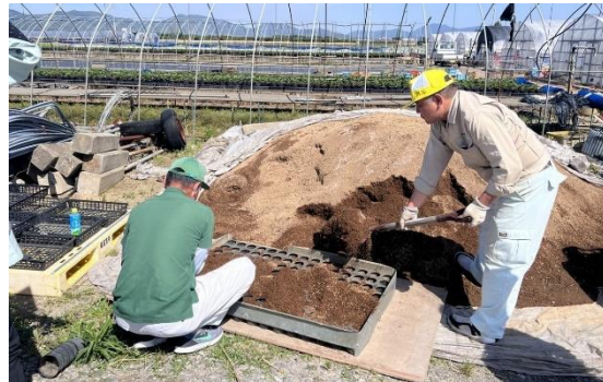
イチゴ子苗ポット土入れ作業