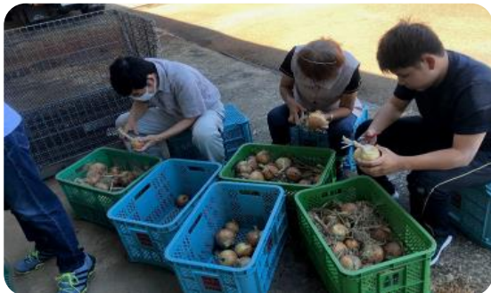
玉ねぎ根切り葉切り