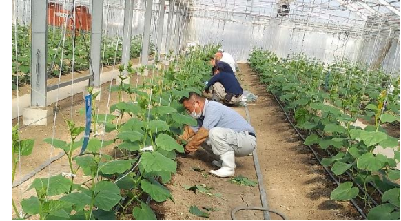
きゅうり下葉かき作業