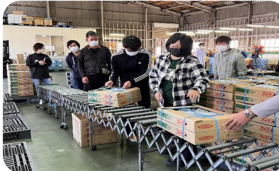
きゅうり箱積み作業