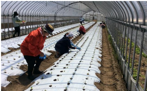
パセリ苗の定植作業