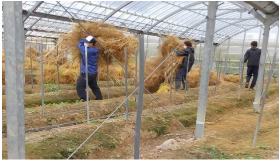
アスパラ茎葉持出し作業