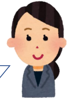
農福連携 コーディネーター