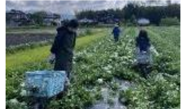
レタス収穫補助作業