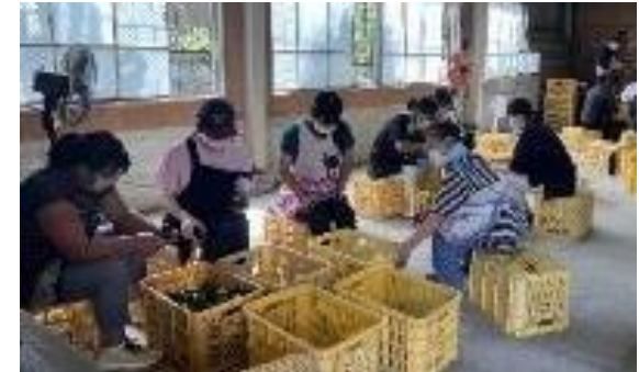
ピーマンへた切り作業