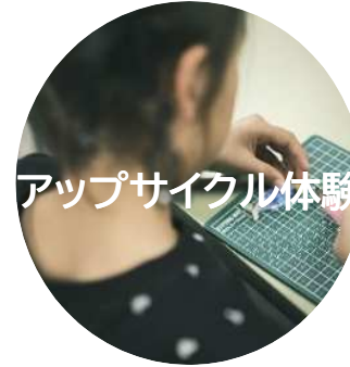
アップサイクル体験