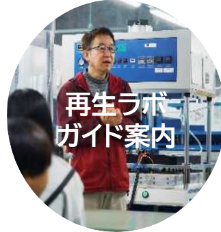
再生ラボ ガイド案内