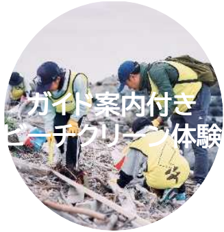
ガイド案内付き ビーチクリーン体験