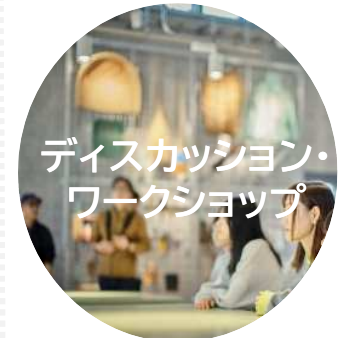
ディスカッション・ ワークショップ