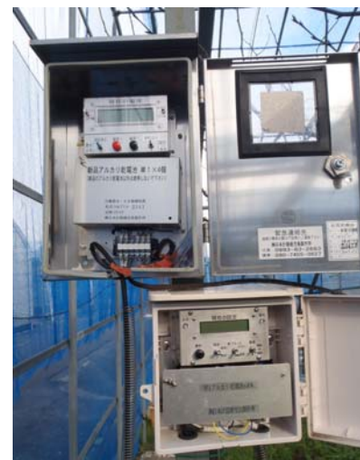
図3 散水制御システム