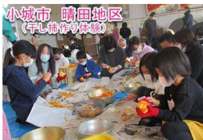
小城市 晴田地区 （干し柿作り体験）