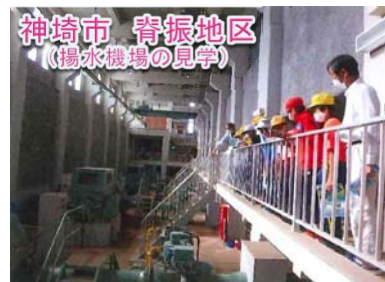
神崎市 脊振地区 （揚水機場の見学）