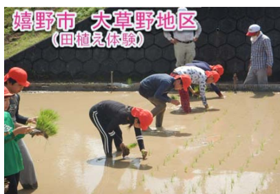
嬉野市 大草野地区 （田植え体験）