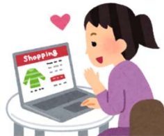
ネットショッピングをする