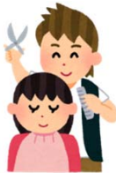
美容院で髪を切る