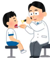
病院で診察を受ける など