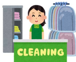
洋服をクリーニングに出す