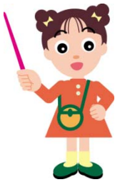
だまされないちゃん

自宅等に関する点検商法には「屋根・雨どい」「外壁工事」「床下」「雨水枡、排水枡等」などがあります。