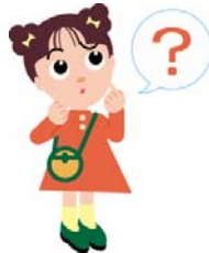
だまされないちゃん