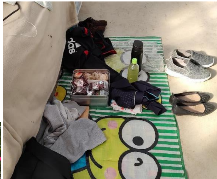
休憩時のお菓子を用意