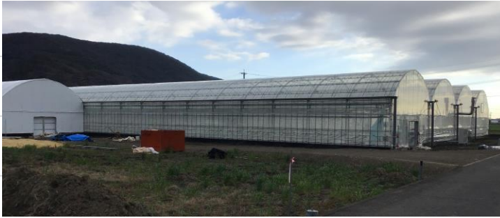
来月から増えるきゅうりハウス