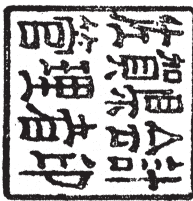
佐賀県会計管理者印