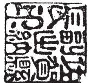
佐賀県副出納長印