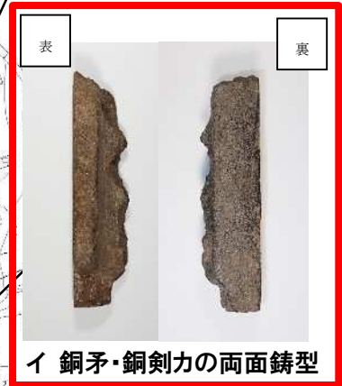
イ 銅矛・銅剣力の両面鑄型