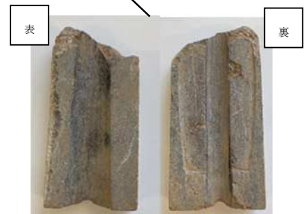
ウ 銅矛・銅剣の両面鑄型