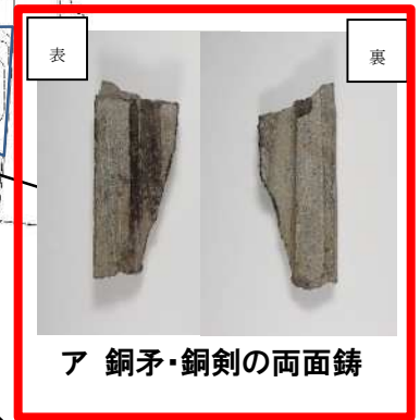
ア 銅矛・銅剣の両面鑄