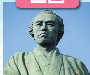
坂本龍馬像 / 最寄: 高知龍馬空港