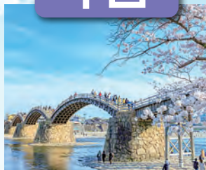
錦帯橋 / 最寄: 岩国錦帯橋空港