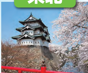
弘前城 / 最寄: 青森空港