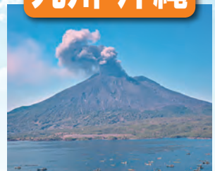
桜島 / 最寄: 鹿児島空港