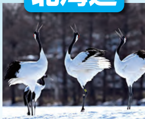
釧路湿原 / 最寄: たんちょう釧路空港