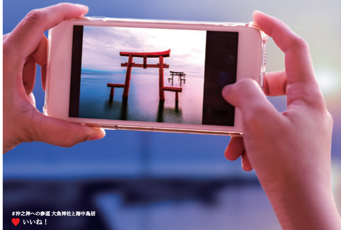
#沖之神への参道 大魚神社と海中鳥居 ❤️ いいね！

佐賀県では、美しい景観や地域を象徴する建造物を「佐賀県遺産」として認定しています。それぞれにまつわる物語や、美しく保たれている遺産をあなたのフィルターを通して、その地を巡り誇りある佐賀県を語りつぎましょう。