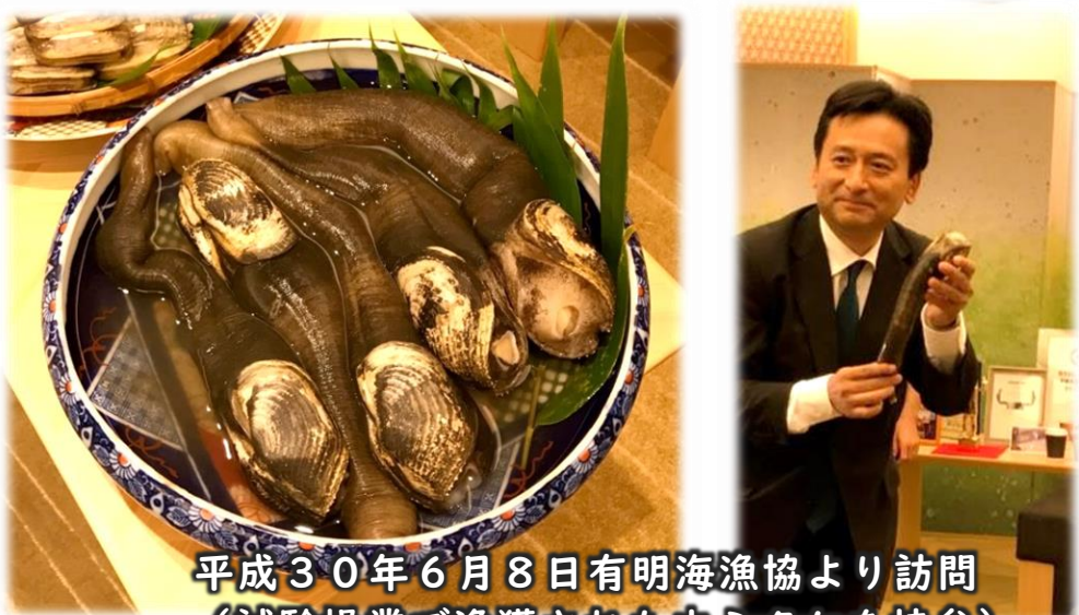
平成30年6月8日有明海漁協より訪問 (試験操業で漁獲されたウミタケを持参)