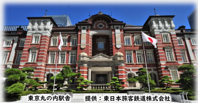
東京丸の内駅舎