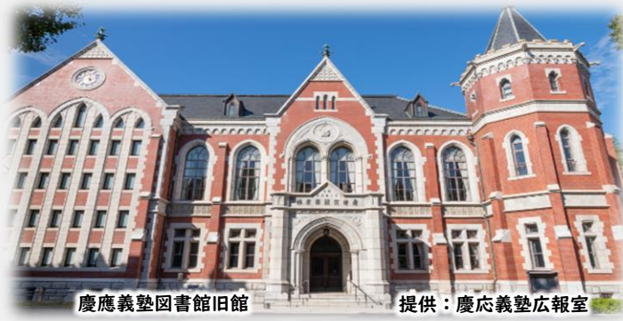
慶應義塾図書館旧館