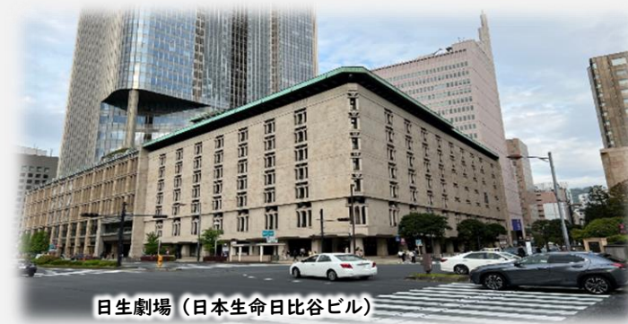
日生劇場（日本生命日比谷ビル）

唐津市との コラボ企画 ：旧三菱合資会社唐津支店本館（唐津市歴史民俗資料館） 特別公開