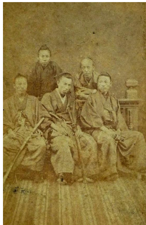
つきじりょうざんぼく 築地梁山泊の集合写真