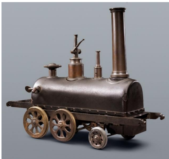
さがはんせいれんかたせいさくじょうきしゃひながた 佐賀藩精煉方製作蒸気車雛形