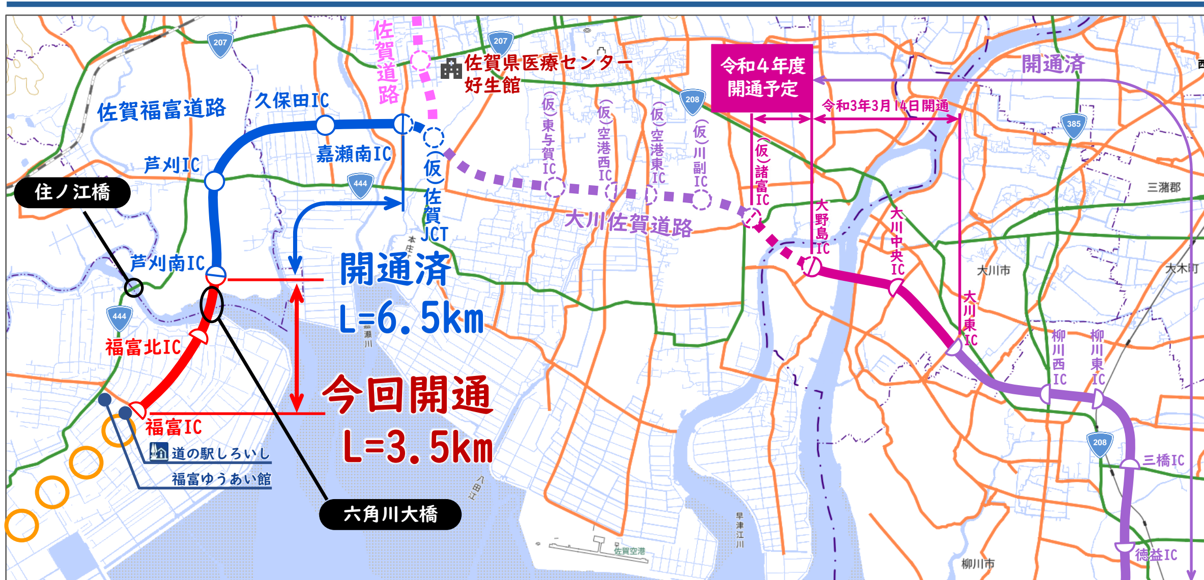
地図：国土地理院地図を加工して作成